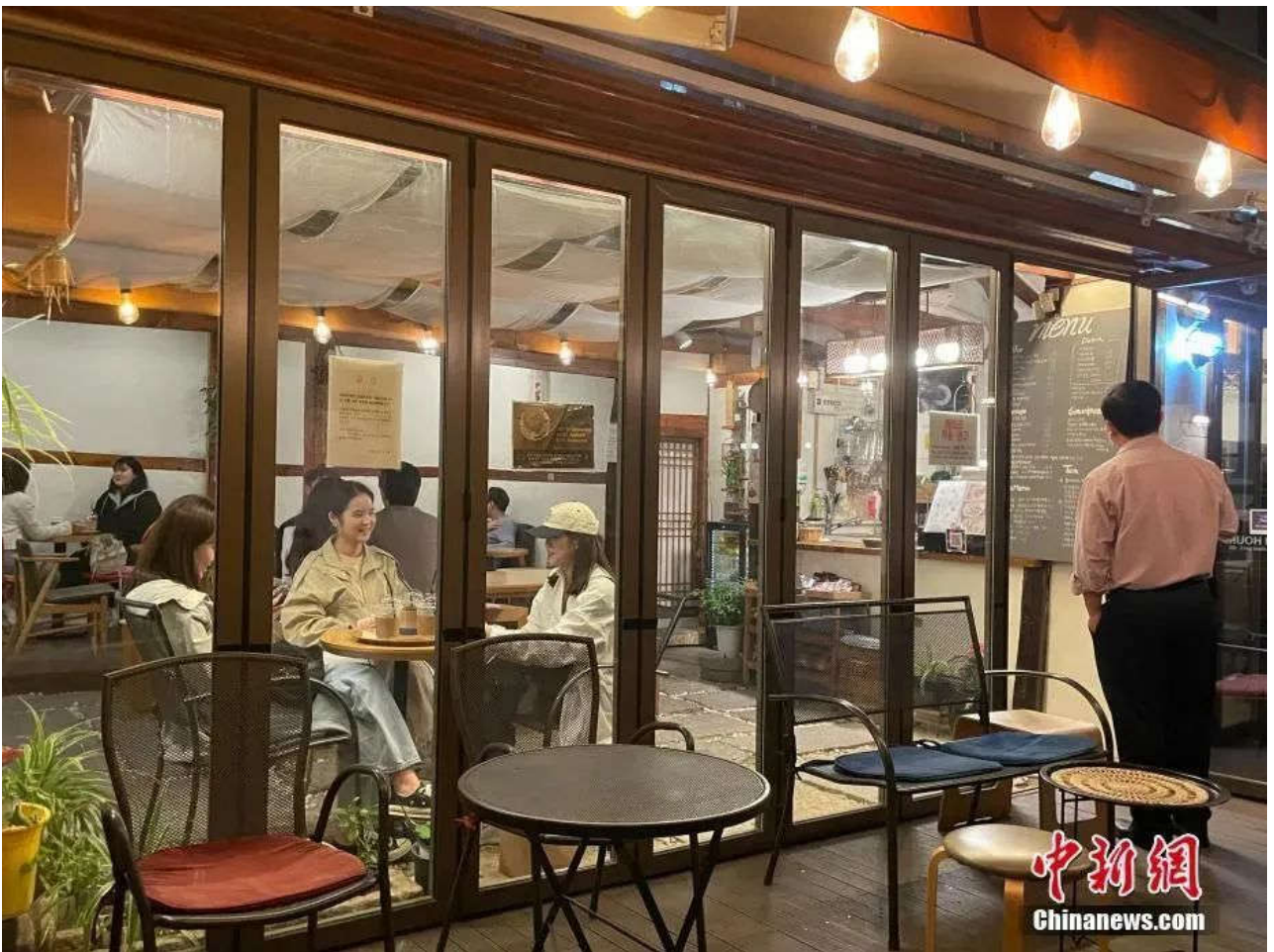
图为韩国民众当晚在首尔麻浦区一咖啡厅聚会。

韩国政府3日表示，由于仁川机场限制执飞航班次数和时间等措施导致航班舱位供不应求、机票价格飞涨，政府决定从8日起全面放开对仁川机场的限制措施。同时，将暂时维持入境前的核酸(PCR)检测或快速抗原检测，以及入境三天内的核酸检测。